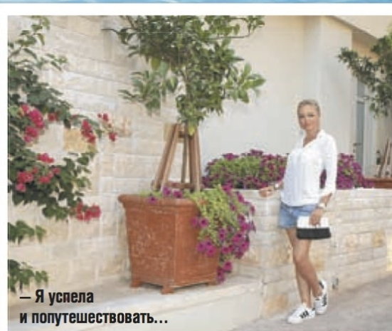
— Я успела и попутешествовать...